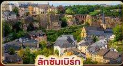
ลักซิมเบิร์ก

ที่สุดของธรรมชาติ แห่ง “ยุโรป” สวนดอกไม้ KEUKENHOF 1ปีมีครั้งเดียว