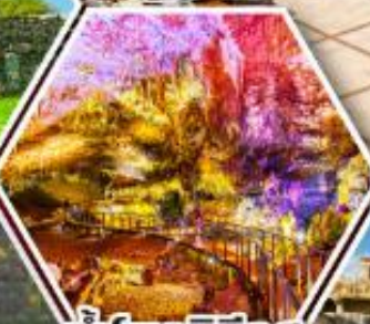
ถ้ำโพรมีธีอุส