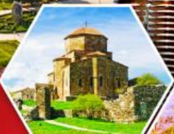
วิหารกอรี