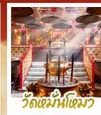
วัดเม้าหนิว