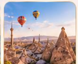
CAPPADOCIA คัปปาโดเกีย