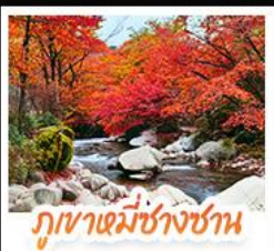
ภูเขาหมี่ซางซาน