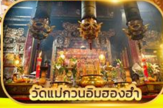
วัดแม่กวนอิมของฮ่า