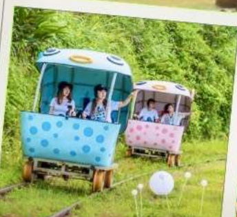
Shen'ao Rail Bike