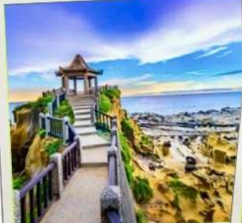
อุทยานเกาะเหอผิง