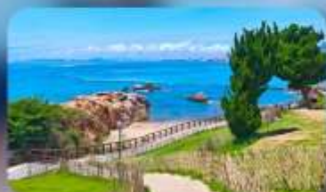
เกาะสี่เหลี่ยมเต่า