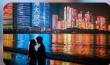
ชายหาดหมายเลข 3