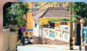
ถนนหลงเจียง