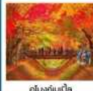
อุโมงค์เมเน็ค