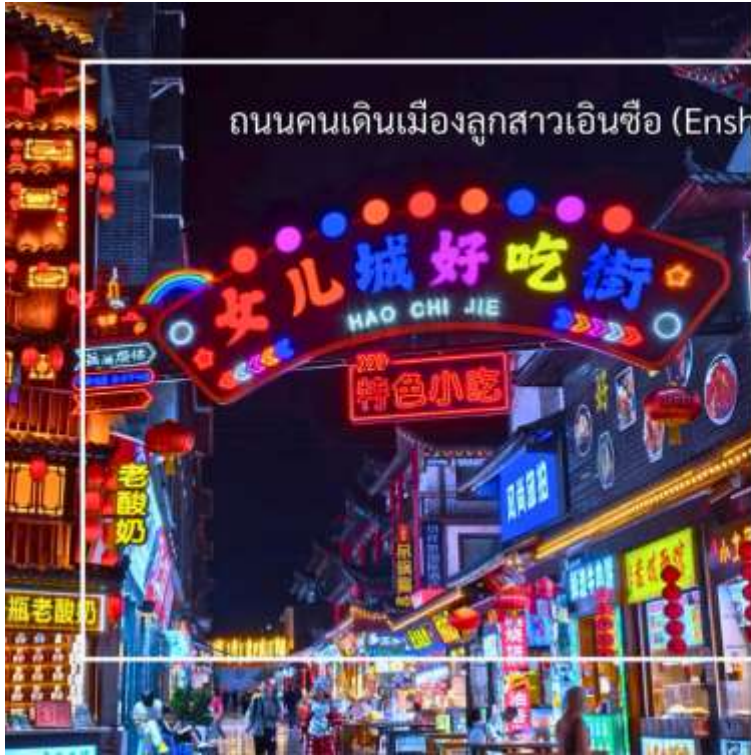
ถนนคนเดินเมืองลูกสาวเินซือ (Enshi Daughter City Pedestrian Street)