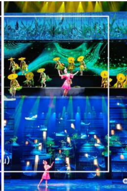
การแสดงโชว์ซีลิ่งคาปู (Xilan Kapu)

เดินทางเข้าโรงแรมที่พัก Xiazhou Hotel ระดับ 4 ดาวหรือเทียบเท่า