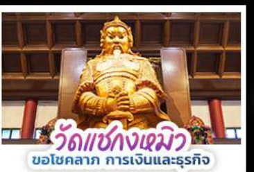
วัดแห่งกงเหมียว ขอโชคกลาง การเงินและธุรกิจ