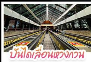
บันไดเลื่อนแขวงหวน