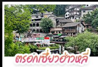
ตรอกเซียวฮ่าวเฉี