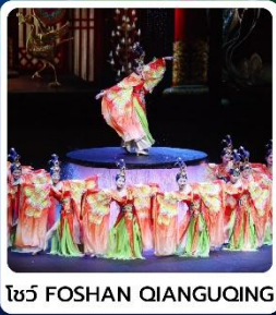
โชว์ FOSHAN QIANGUQING