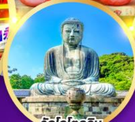
วัดโคโคคุอิน