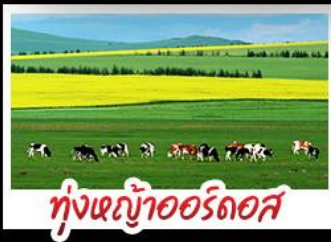
ทุ่งหญ้าฮอร์ดอส

ทุ่งหญ้าฮอร์ดอส สุสานเจกิสข่าน แกรนด์แคนยอนแม่น้ำเหลือง