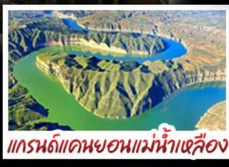
แกรนด์แคนยอนแม่น้ำเหลือง