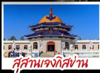
สุสานเจกิสข่าน