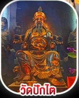
วัดบิกโต