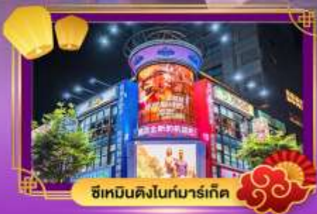
ซีเหมินดิงไนท์มาร์เก็ต