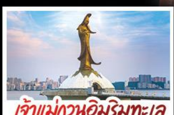
เจ้าแม่กวนอิมริมทะเล