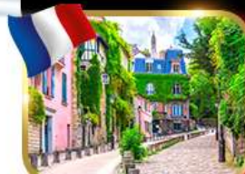
Rue de l'Abreuvoir มงมาร์ต