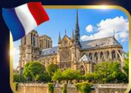
มหาวิหารนอร์ม็องดี