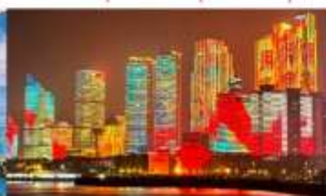
อ่าวฟู่ซาน