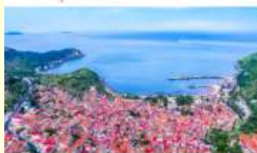
หมู่บ้านชาวประมง