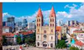
โบสถ์คริสต์เซนต์ไมเคิล

*ทางบริษัทฯ ขอสงวนสิทธิ์ในการสลับโปรแกรมทัวร์ตามความเหมาะสมขึ้นอยู่กับสถานการณ์หน้างาน โดยคำนึงถึงผลประโยชน์ของลูกค้าเป็นสำคัญ