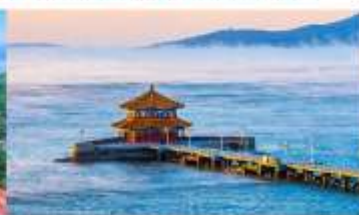
สะพานจันเจียว