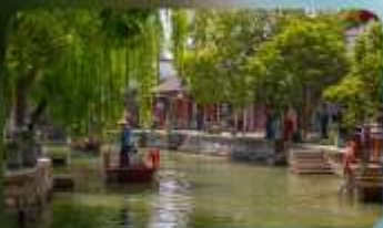
เมืองโบราณจูเจียเจีว

HOLIDAY INN EXPRESS HOTEL หรือเทียบเท่า 4 ดาว