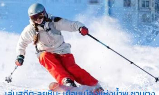
เล่นสกีทะเลยหิมะ เมืองเมืองแห่งน้ำพุ ชานตง