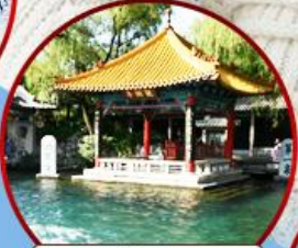
บ่อน้ำพุเป่าหู