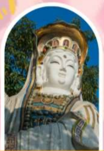
ริพลัสเบย์ รับพลังงานดี เสริมพลังดวงจู้ย