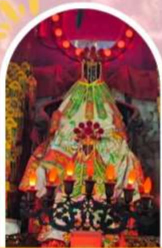
วัดเจ้าแม่กวนอิมอ่องอ่า ขอพรเรื่องเงิน ทรัพย์สิน และความมั่งคั่ง