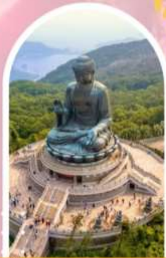
นั่งกระเช้ามองปีง นมัสการพระใหญ่ไป่หวลัน