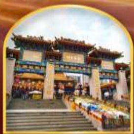
วัดหวังต้าเซียน ขอพรด้านสุขภาพ