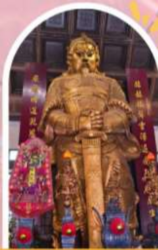
วัดแซกกง ขอพรโชคลาก การเงิน และธุรกิจ