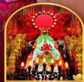
เจ้าแม่กวนอิมฮ่องซ่า ที่มีอายุกว่า 600 ปี