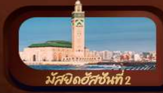
มัสยิดฮัสซันที่ 2

มื้อพิเศษ อาหารไทย-จีน อาหารพื้นเมืองโมร็อกโก