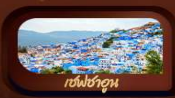
เชฟชาอูน