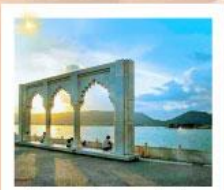
Ana Sagar Lake