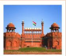
♥♦♦ Agra Fort