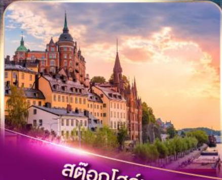
สต็อกโฮล์ม เวเนเซียแห่งยุโรปเหนือ